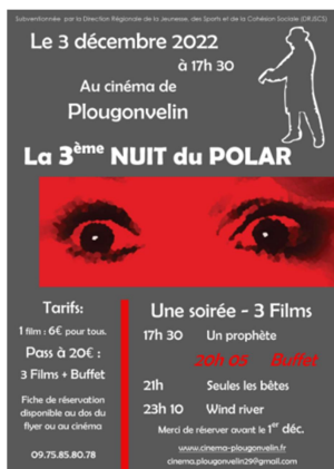
Coupon de Pass